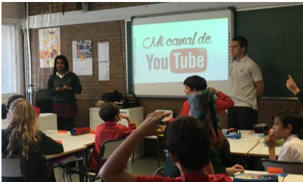
Nuestras Alumnas TIC de 4ºESO en las aulas de 5º y 6º EP