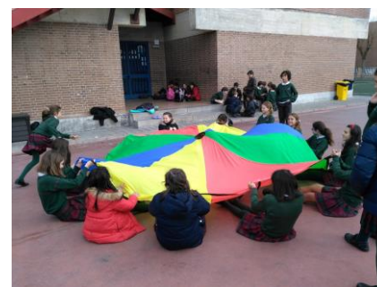
Transformando nuestros patios