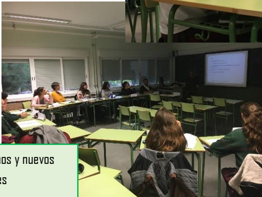
Formación de nuevos alumnos y nuevos profes Mediadores