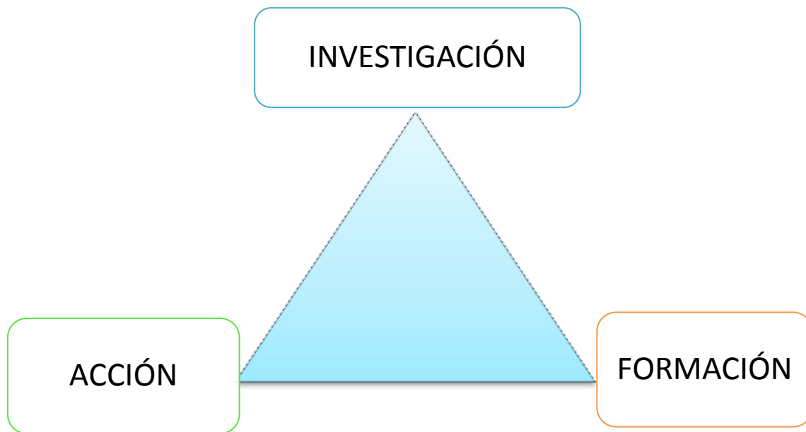
Figura 1. Triángulo de Lewin.

Nota.