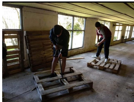
Desmontando pallets para reutilizar la madera