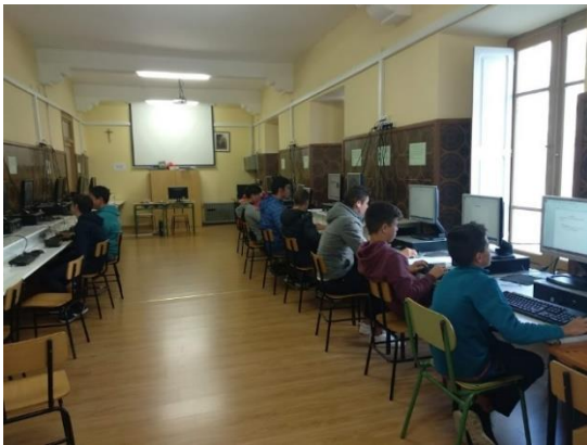
Búsqueda de información online.

A continuación se muestran algunas fotos del proceso: