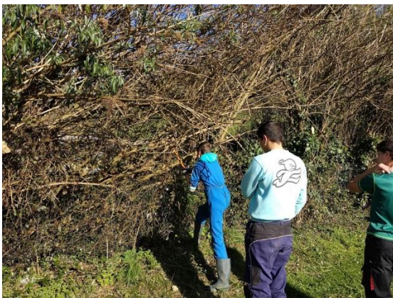
Limpieza del terreno.