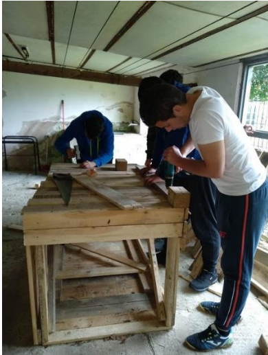
Montando el gallinero