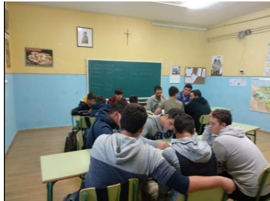
Fase de diseño y cálculo de los costes de ese gallinero.