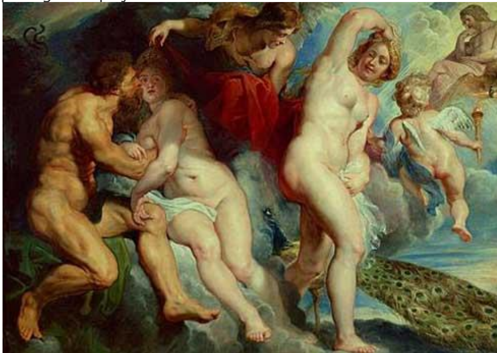
Nèfele de Rubens

En la mitologia grega Nèfele era la deessa dels núvols. Es casà amb Atamant i fou mare de Frixos i d' Hel·lè . Després el marit la va repudiar per casar-se amb Ino. Quan els seus fills eren a punt d'ésser sacrificats, els va salvar enviant-los el moltó del velló d'or, animal prodigiós capaç de volar.