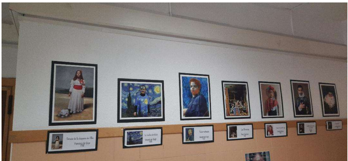
Vista general del pasillo