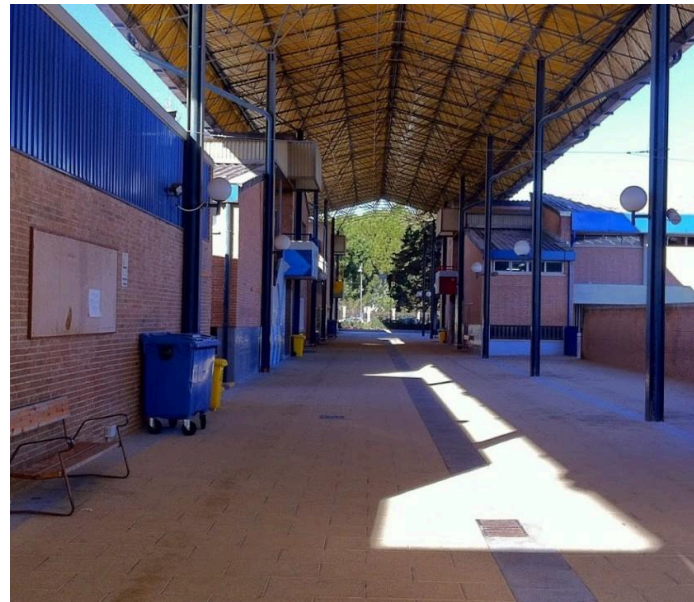
Escuelas Pías de San Fernando Pozuelo de Alarcón, Madrid