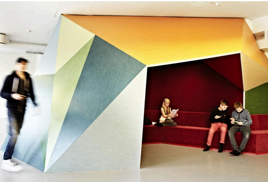
Escuela Vittra Södermalm Stockholm, Suecia Rosan Bosch

Reflexión sobre la integración de la educación y la arquitectura aplicada a la realidad de las Escuelas Pías de San Fernando, Pozuelo de Alarcón.