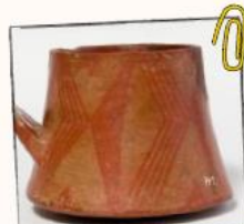
Cerámica aborígen Museo Canario

Vivían en cuevas ubicadas en acantilados cerca de la costa y en paredes de barranco. Sabemos que en Gran Canaria se construyeron casas de piedra y cuevas artificiales.